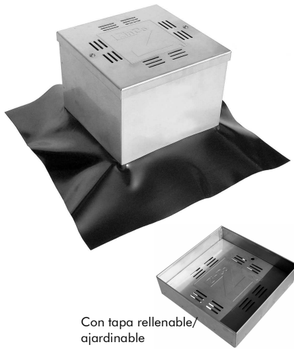
Con tapa rellenable/ ajardinable

Caja de control en acero inoxidable de alta calidad para protección y control de los desagües y otros componentes de cubiertas intensivas.