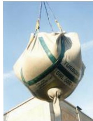
Colocación del sistema Floradrain®-E instalación del sustrato ZincoTerra con Turbo-Bag