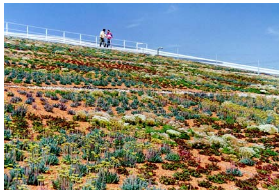
Cubierta ecológica en un parque natural en una zona de gran contraste térmico estacional.